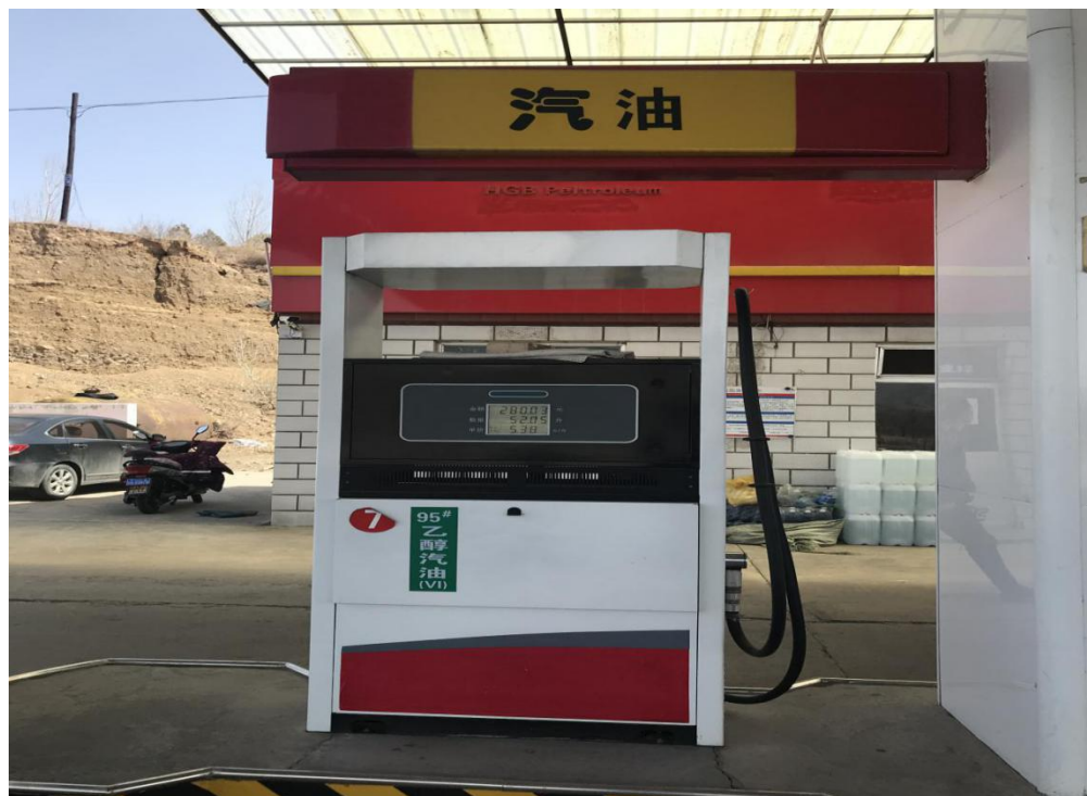
带油气回收加油枪